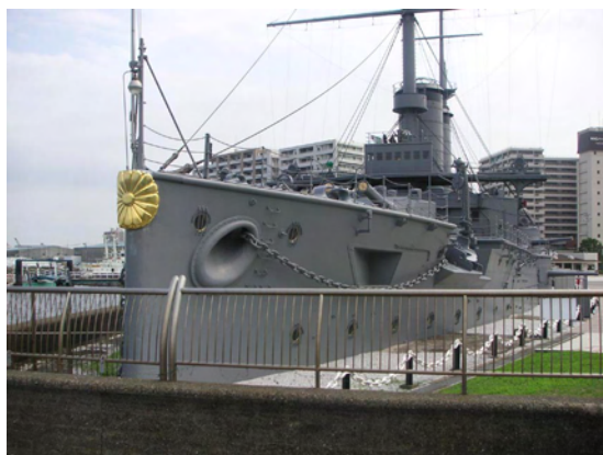
三笠公園の船艦三笠