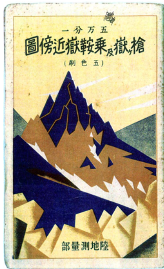
内地官版山岳図表紙一例 槍ヶ嶽及乗鞍嶽近傍圖、昭和5年(定価45銭)

ICICニュース Vol.11 No.3通巻39号 発行年月日:2006年(平成18年)12月1日 編集・発行:財団法人 地図情報センター 〒101-0051 東京都千代田区神田神保町2-5 神保町センタービル5階 Tel.03-3262-1486 Fax.03-3234-0872 http://www.soc.nii.ac.jp/icic/ E-mail icic_map@yahoo.co.jp