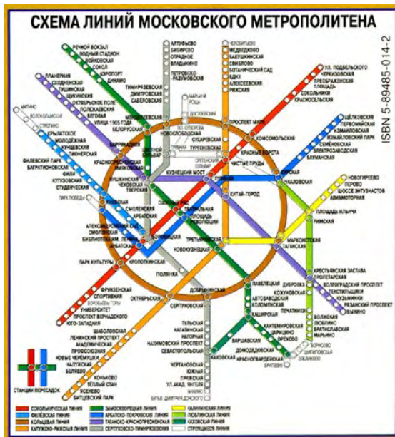
モスクワ市内地下鉄網図：モスクワ市内交通案内（バス、トrolleyバス、路面電車、ポケット版）裏表紙による。

モーターのうなりの高い同色の電車が、単調な車掌の肉声案内を繰返えし、間隔短く高速で、今日も各線を走行していることであろう。(05.08.15)