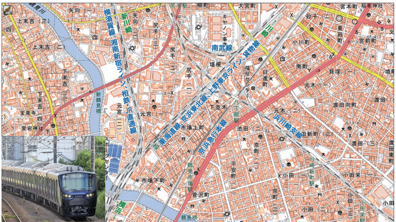
図1 ベースマップは地理院地図、左下は相模鉄道の濃紺の車両